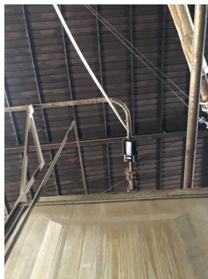
電磁波水垢清除裝置 安裝於蒸汽鍋爐的管道上